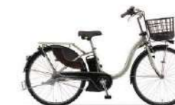
カラー:シャンパンシルバー 26インチのみ