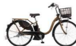
カラー:マットナチュラルブラウン