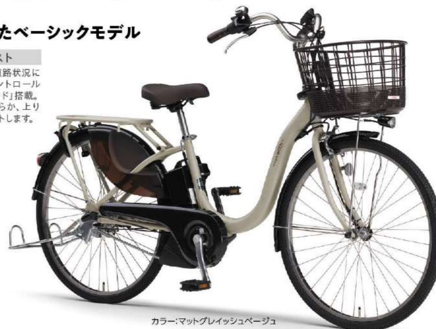
カラー:マットグレイッシュベージュ