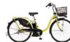
カラー:マットマーガレットイエロー 26インチのみ