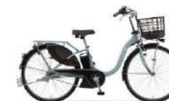
カラー:マットスモーキーブルー