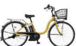
カラー:スモーキーイエロー 26インチのみ