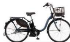
カラー:ダスティダークブルー