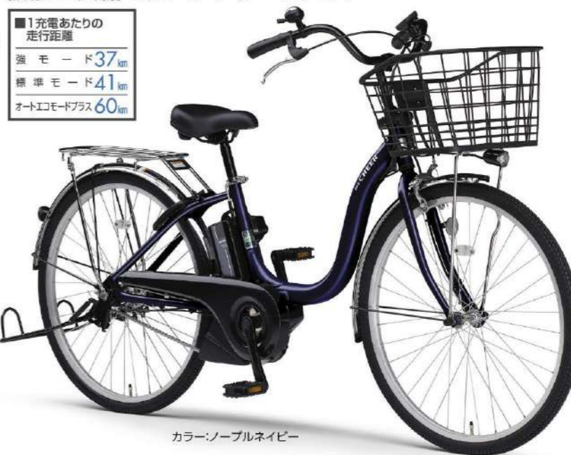
カラー:ノーブルネイビー

C25 ヤマハ PAS CHEER チェア PA24CH/PA26CH ※スマートパワーアシストの搭載により変速なしとなります。