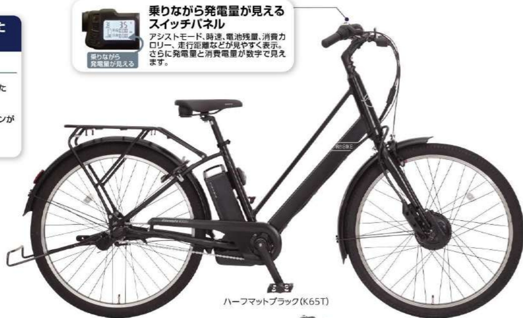
ハーフマットブラック (K65T)

乗りながら発電量が見えるスイッチパネル アシストモード、時速、電池残量、消費カロリー、走行距離などが見やすく表示。さらに発電量と消費電量が数字で見えます。