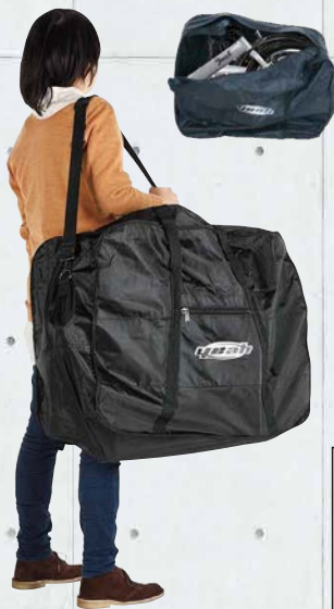
ショルダーベルトが付いています。

※取付け工賃は別途となります。※掲載された商品は、仕様・価格等を予告なく変更する場合がありますのでご了承ください。