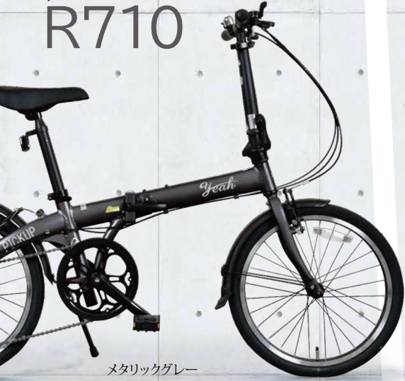
メタリックグレー