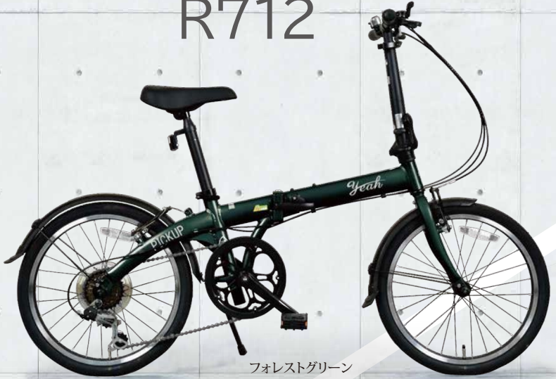
フォレストグリーン