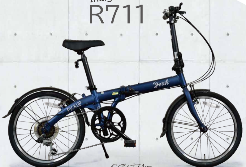
インディゴブルー